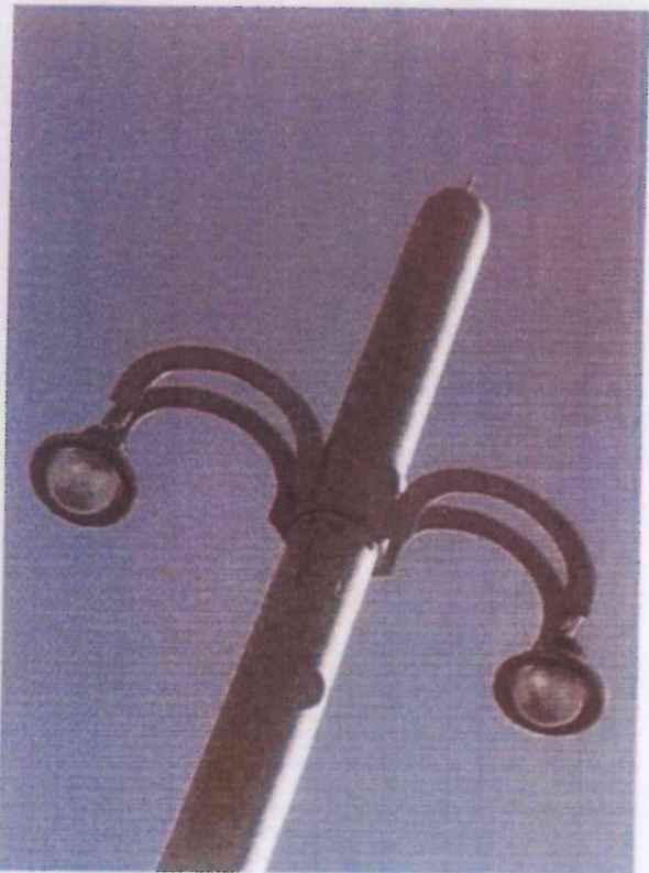
integrazione con illuminazione pubblica