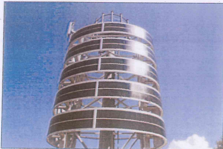
integrazione con pannelli fotovoltaici (sperimentazione Telecom Ericsson)