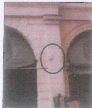
Esempi di microcelle