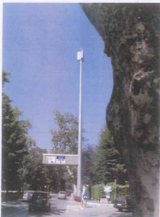
Integrazione con segnaletica