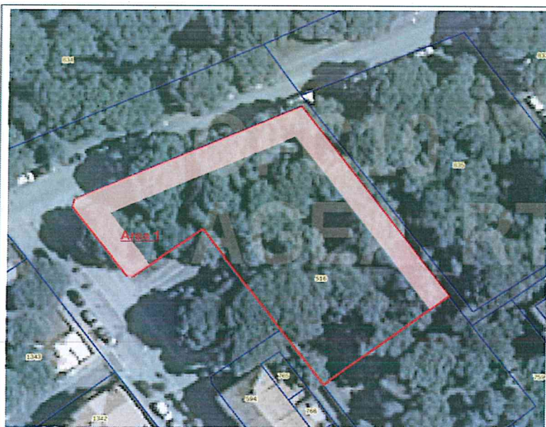
Cartografia catastale dell'Area 1 con individuazione di una fascia tampone con funzione multipla;

Tale fascia dovrà avere una larghezza indicativa minima di 5 m; si potranno mantenere, ove possibile, le ceppaie di sottobosco già presenti nel terreno, implementandole con nuovi impianti con le specie e le modalità sotto descritte.